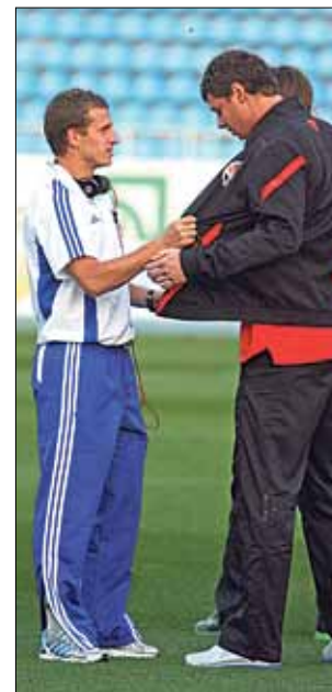
► Алиев перед матчем рассматривал форму Рыбки...